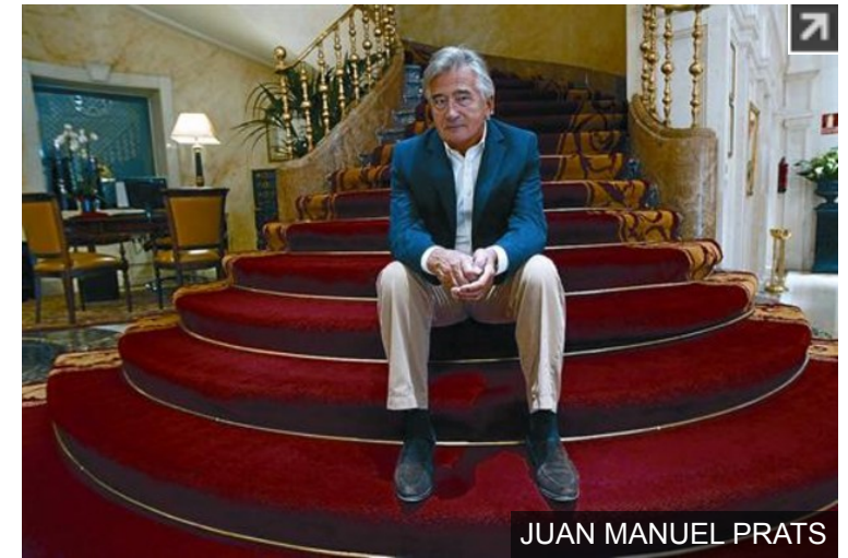
El historiador británico Antony Beevor, ayer en Madrid.

Los lectores fieles de Antony Beevor tienen ante sí un reto monumental: La segunda guerra mundial (Pasado & Presente). Ya no el relato de episodios como Stalingrado, Berlín, Creta, la liberación de París o el Día D sino todo esto y más. Más de 1.200 páginas en que el historiador-narrador británico consigue seguir explicando historias tan vivas como en sus anteriores libros al mismo tiempo que dibuja el panorama general del conflicto y penetra en nuevos territorios, como las campañas del Pacífico y, sobre todo, China. Pero, ¿por qué otra historia de esa guerra, otra vez más? Una cita del periodista soviético Vasili Grossman sobre Treblinka, que Beevor recoge en su libro, quizá da una respuesta: «La obligación del escritor es explicar esta terrible verdad, y la obligación cívil del lector es conocerla». Beevor, en Madrid para presentar su libro, se explica perfectamente la «fascinación, incluso entre las jóvenes generaciones», que no ha desaparecido. En la guerra, y en aquella más que en ninguna otra, «se tienen que hacer elecciones de índole moral, y esas decisiones son el drama humano».